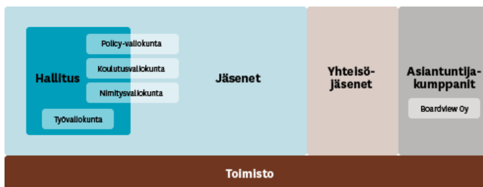
Kuva 5. DIF:n rakenne

Osa hallituksen jäsenistä on myös työvaliokunnan jäseniä. Policy- ja koulutusvaliokuntaan puolestaan kuuluu jäseniä paitsi hallituksesta, myös muusta jäsenistöstä.